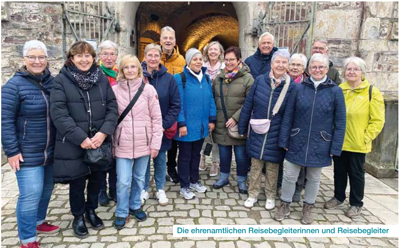
Die ehrenamtlichen Reisebegleiterinnen und Reisebegleiter