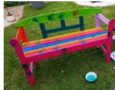
Ein Beispiel (etwas bunt) könnte so aussehen.

Vielleicht darfst du dein Zimmer auch umräumen oder umstellen? Oder vielleicht kannst du ein paar Möbelstücke neu gestalten.